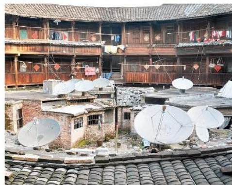
民居土樓的小耳朵，新舊並存。

任何一項世界文化遺產都涉及保護與開發的問題，「世遺」是國家的榮譽，也為地方旅遊業帶來商機。以土樓為例，位處偏遠貧困山區的土樓，得不到資源進行保育，只會不斷衰敗；然而，成功申遺雖帶來了機遇，旅遊開發帶來龐大收益，卻未見令土樓得到保育。土樓雖已是中國第三十六個世界文化遺產，中國旅遊當局還未從過去因過度開發及人為破壞，造成對遺產負面影響，汲取經驗與教訓。