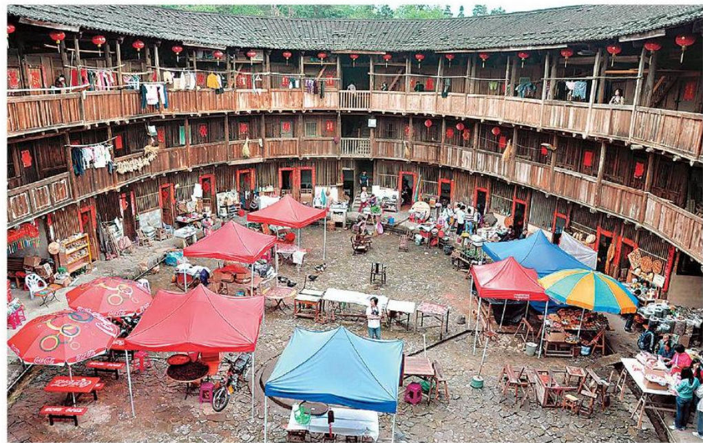
田螺坑土樓群的「文昌樓」內四處攤販，儼如墟市。

在土樓得到「世遺」名號後，官員原也訂定了一些保育方案，如限制參觀者登樓人數、制定《土樓文化遺產保護管理規定》等，可是這些都只屬一紙空談。旅遊局只囑咐每幢對外開