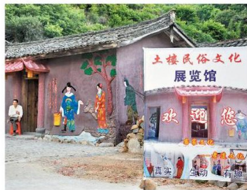
村民也來湊興搞「文化旅遊」